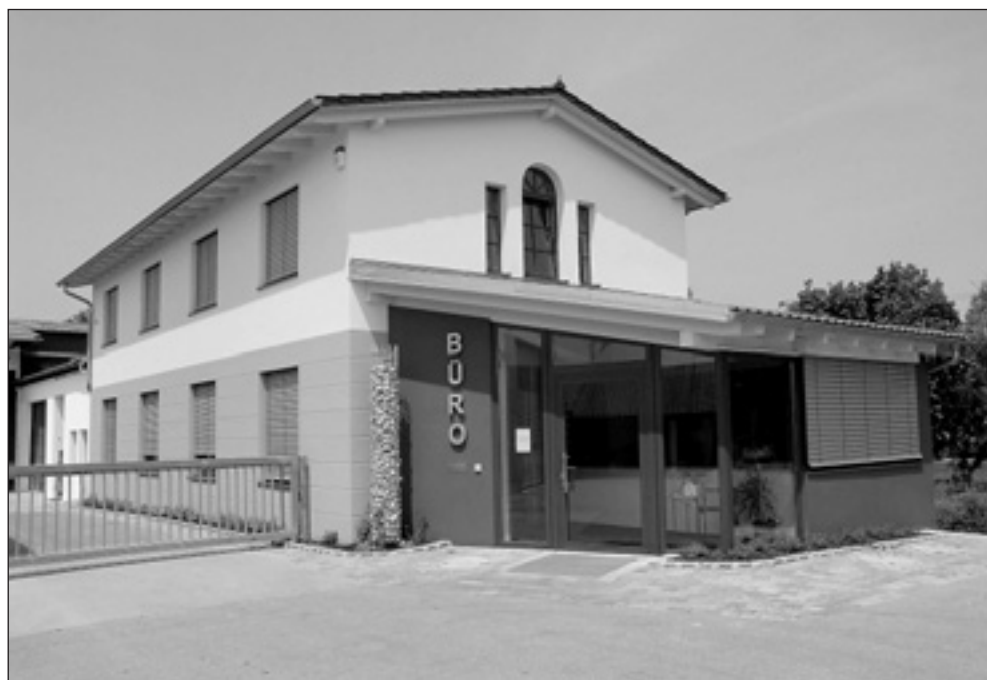
Der neuerbaute Bürotrakt in mediterraner Farbgebung.