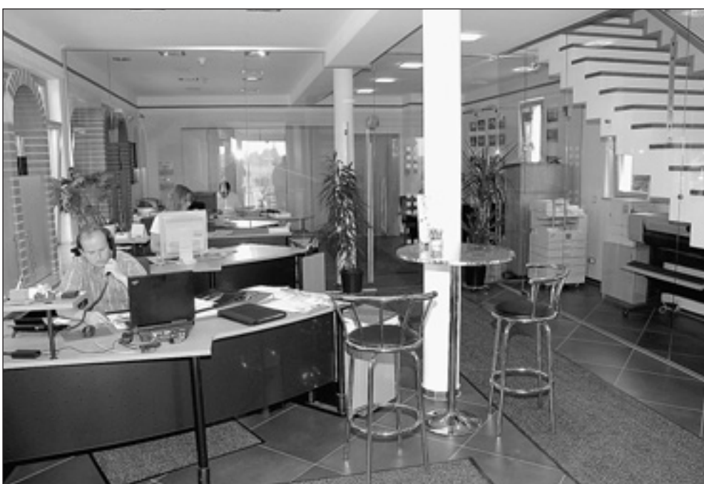
Die neuen Büroräume im freundlichen Ambiente.