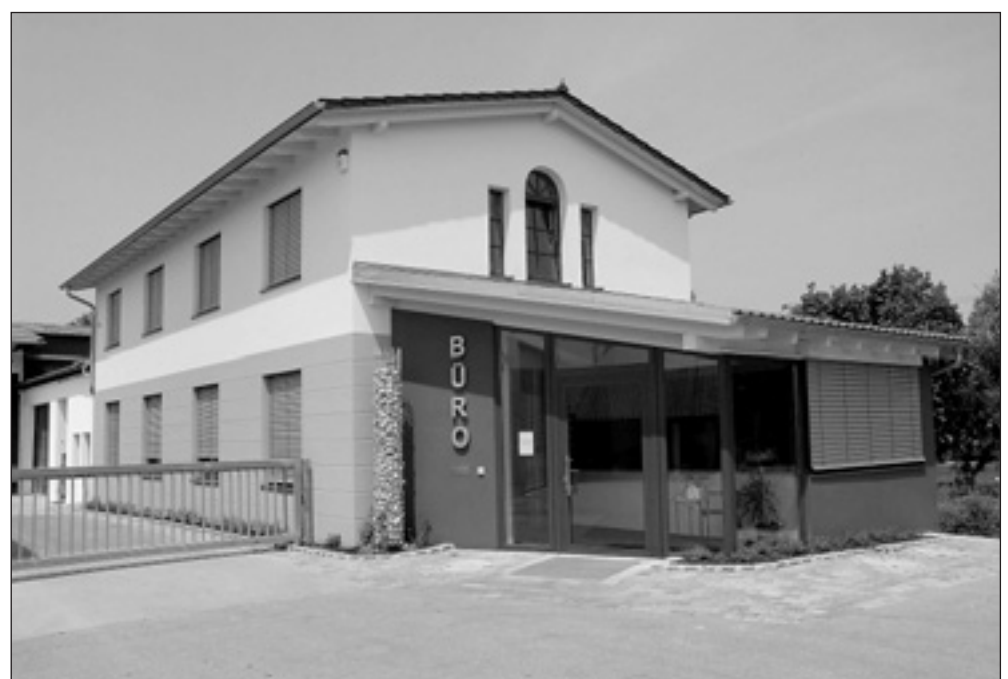
Der neuerbaute Bürotrakt in mediterraner Farbgebung.